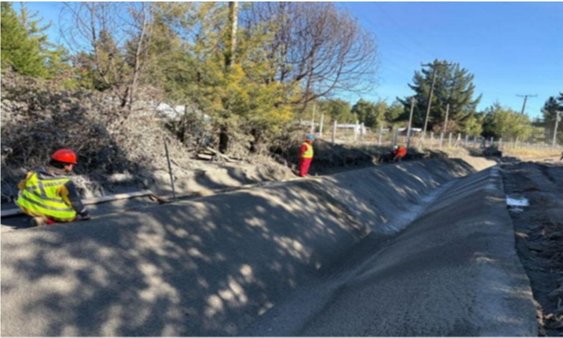
Revestimiento Hormigón Proyecto Sector Manque Norte