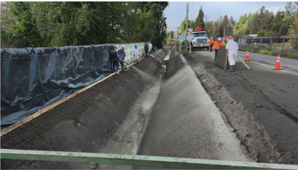
Revestimiento hormigón proyectado canal Matriz sector Chillancito