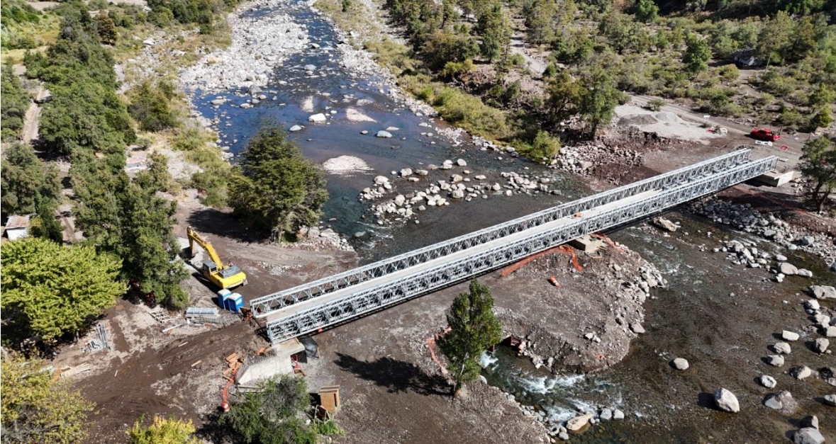
Pte. Los Sauces

2. Camino básico por conservación ruta N-14-O, cruce ruta 126 S (Coelemu) - cruce O-274 (Tomé), sector: Coelemu- límite regional (Purema), Km 0,000 AL Km 9,266, comuna de Coelemu, provincia de Itata, región de Ñuble