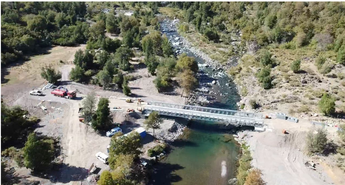
Pte. Las Truchas