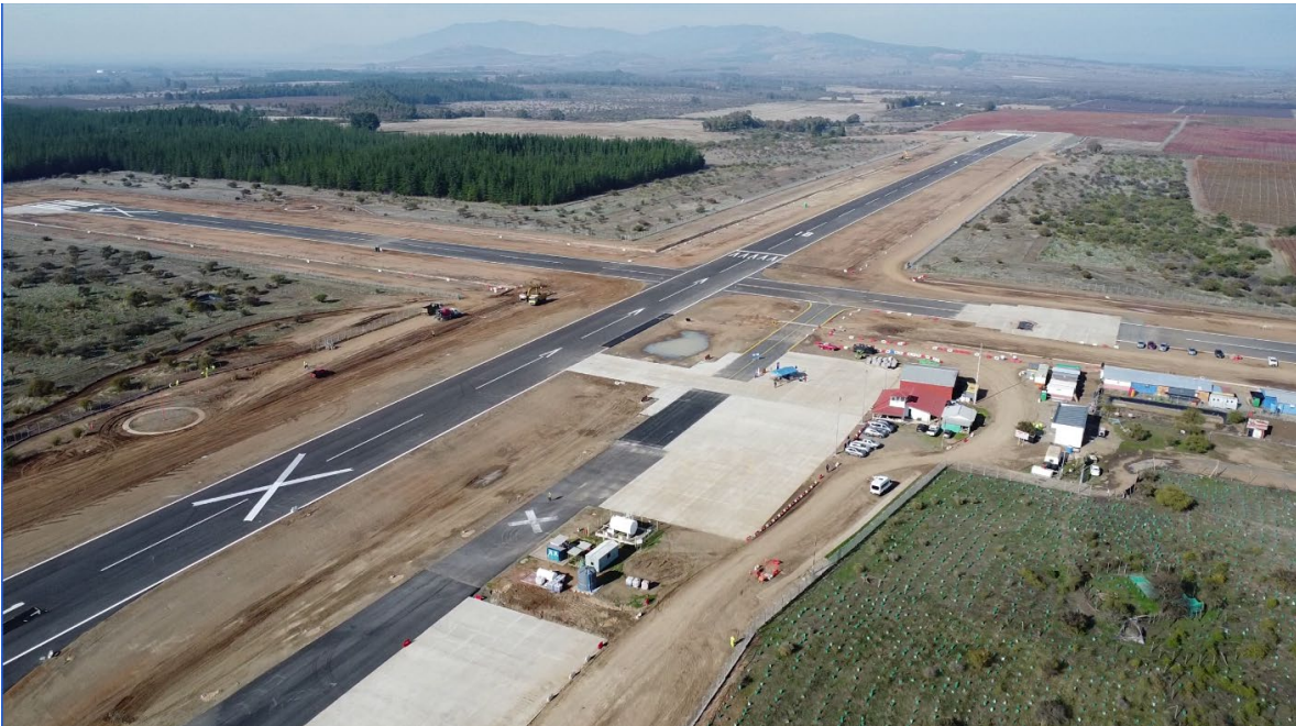
Aeródromo el Boldo

Esta etapa incluyó la construcción de una nueva calle de rodaje Alfa y el ensanche de la calle Bravo, la ampliación de la plataforma de estacionamiento de aviación civil, la construcción de una plataforma para aeronaves dedicadas a la extinción de incendios, y la finalización de la pavimentación de la pista secundaria este-oeste, que era de tierra. También se instalaron luces en el borde de la pista principal, en rodajes y plataformas, así como pintura demarcatoria.