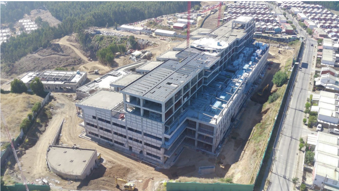
Hospital de Constitución