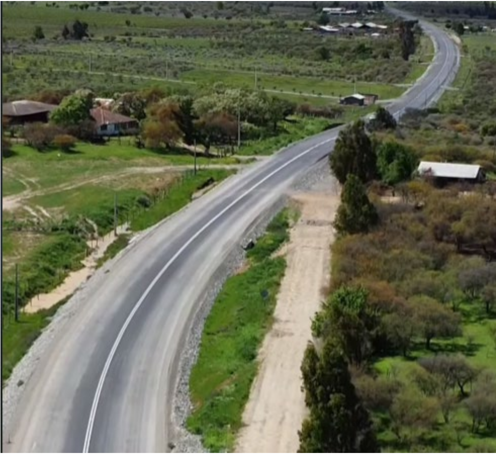
Mejoramiento ruta I-32, sector pte. Marimaura-cruce ruta 126