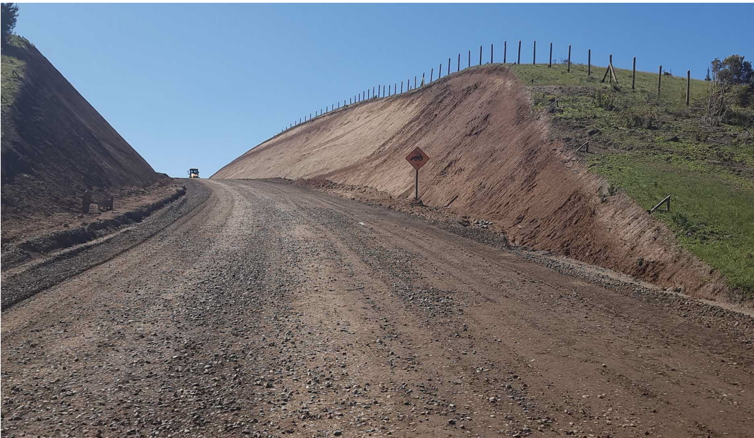
Mejoramiento Camino Básico Intermedio Ruta K-20, Sector Gualleco - Carrizal