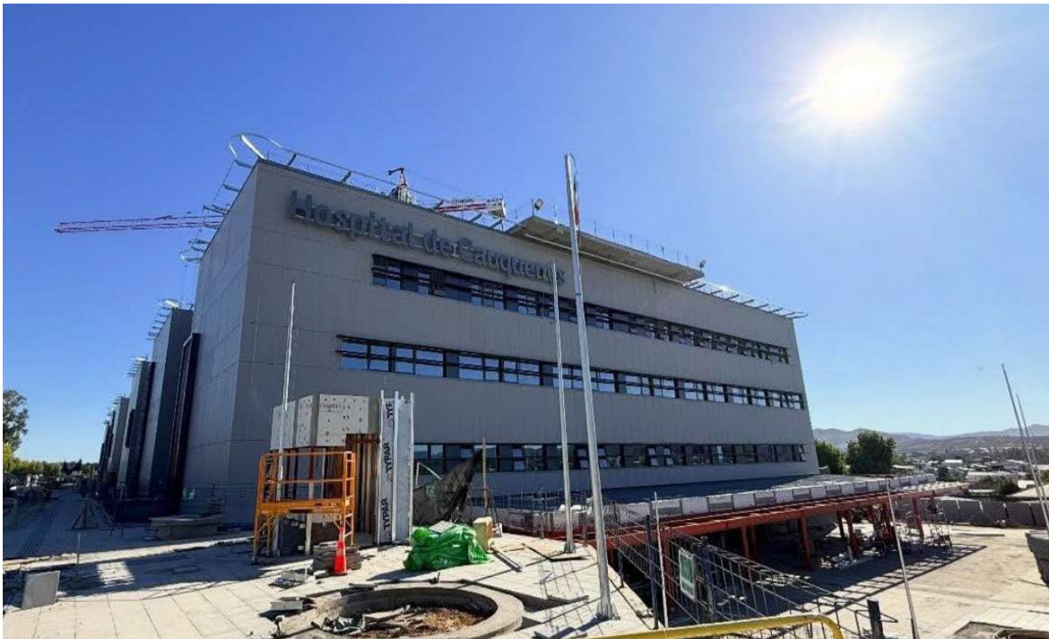
Hospital de cauquenes

Hospital de Constitución, 19 de enero 2026, 85% de avance de obras.