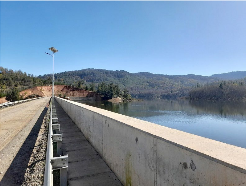
Red de riego embalse empedrado

Para la Red de Riego se optó por una conducción de tubería en presión para evitar las pérdidas por filtración, disminuir los costos de mantenimiento y tener entregas controladas. Esta red de presión tendrá un diseño telescópico, es decir, tendrá un diámetro variable el cual va disminuyendo de acuerdo con los caudales entregados cada cierto tramo.