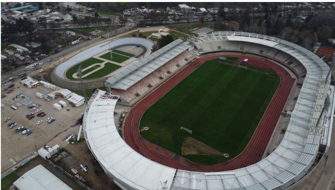
Estadio la Granja

Monto inversión: $9.607.486.426. La obra contempla la ampliación del aforo actual del estadio, de 8000 a 12000 espectadores. Avance de un 95%, se proyecta entregar a explotación el 1er semestre de 2026.