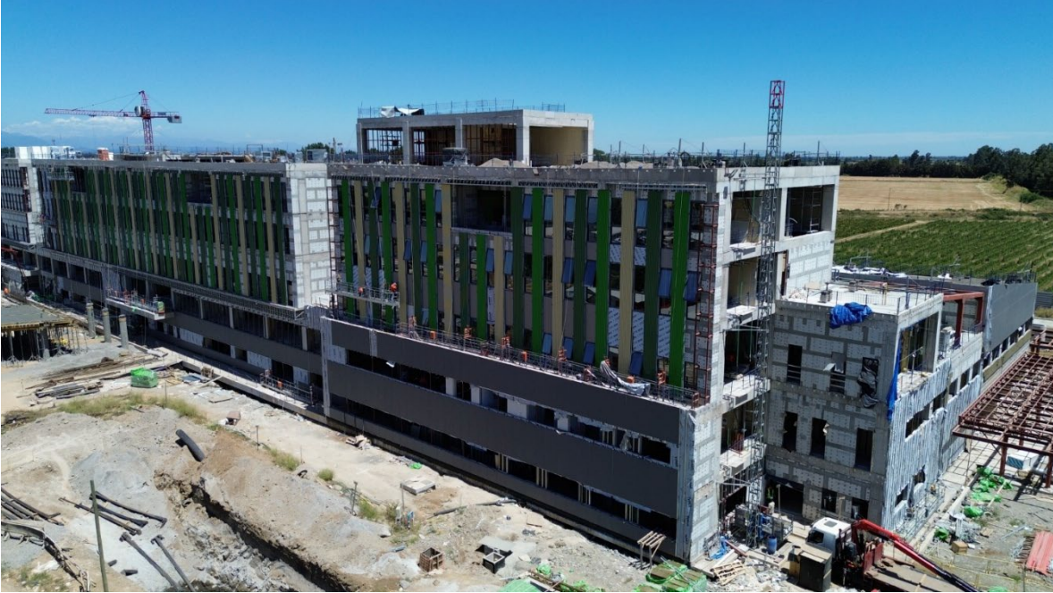
Hospital de Parral