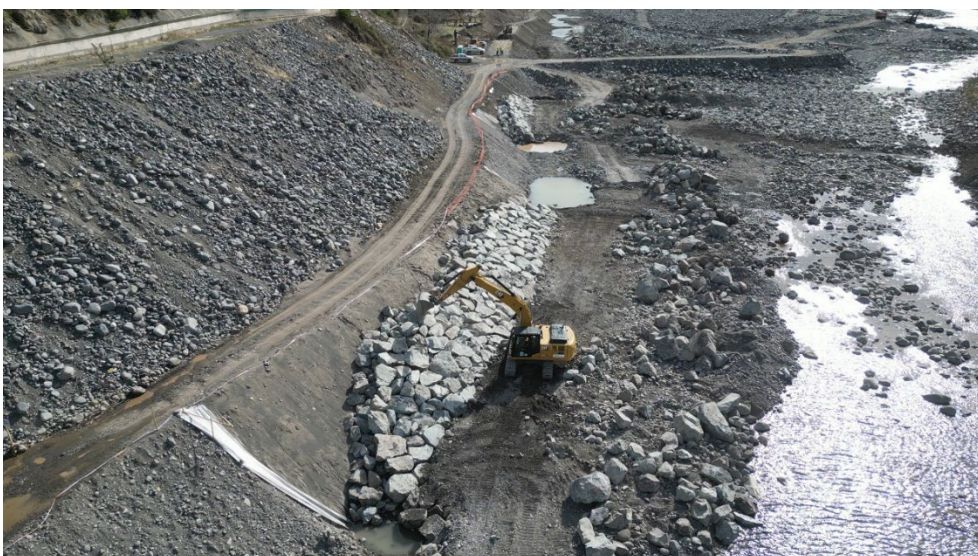
Sistema De Riego Canal Melado

Para la Red de Riego se optó por una conducción de tubería en presión para evitar las pérdidas por filtración, disminuir los costos de mantenimiento y tener entregas controladas. Esta red de presión tendrá un diseño telescópico, es decir, tendrá un diámetro variable el cual va disminuyendo de acuerdo con los caudales entregados cada cierto tramo.