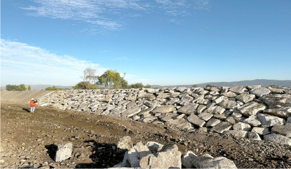
Defensas Fluviales Rio Teno

Considera la protección de los cauces naturales de toda la región. Dichas faenas consistirán, principalmente, en labores de mantención para la regularización de cauces con maquinaria excavadora y/o buldózer; gaviones, enrocados, encauzamientos y otros, que disminuyan los riesgos de inundaciones ocasionados por desbordes de crecidas en poblaciones, terrenos e infraestructura.