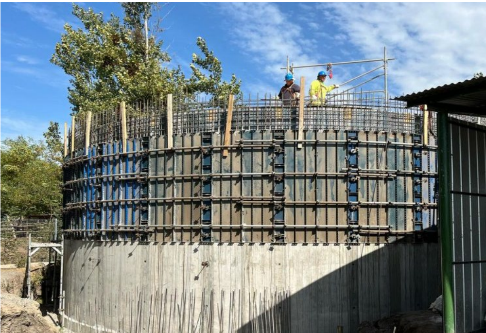
Apr Los Cristales, Longaví

Los habitantes de la localidad de los cristales, en la comuna de longaví, se abastecen en su mayoría del sistema de agua potable existente, y en menor medida de pozos someros (tipo noria) y compra de agua embotellada. Dada la condición de algunos tramos de la red de distribución (materialidad, diámetro), además de la cobertura, el abastecimiento de agua para los habitantes se ve afectado en disponibilidad, continuidad y calidad de servicio. Se debe además cumplir con la normativa actualizada y considerar, en este caso, condición de incendio. Para dar solución al problema que enfrenta la localidad, se proyecta un mejoramiento integral del sistema, contempla la renovación total de la infraestructura sanitaria. En concreto, se considera la renovación de equipo de bombeo por uno de mayor capacidad (15,9 litros por segundo y 31,1 metros columna de agua), impulsión en hdpe, sistema de cloración nuevo, interconexiones recinto, nuevo estanque de regulación semienterrado de capacidad 500 metros cúbicos, red de distribución nueva en hdpe diversos diámetros, y acero galvanizado para atravesos, totalizando 16,9 km aproximadamente, abarcando sectores de ampliación, 708 arranques nuevos considerando reemplazos y nuevos usuarios.