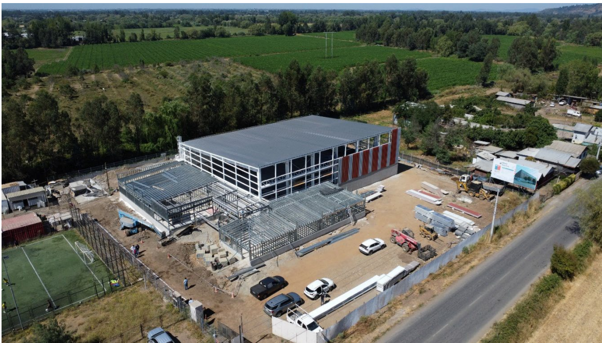
Polideportivo Yerbas Buenas

Monto inversión: $3.815.552.339. Se contempla la construcción de 1.602,5 m 2 de infraestructura. La instalación considera aparte de la multicancha principal una sala de musculación. Avance de un 48%, se proyecta entregar a explotación el 2do semestre de 2026.