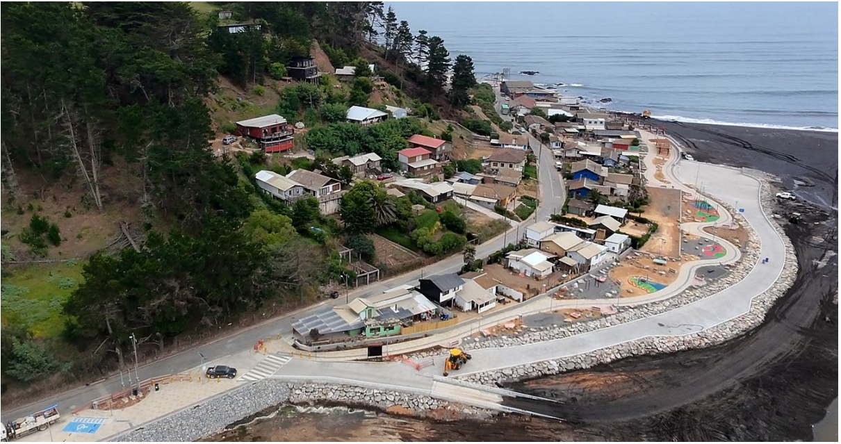
Borde Costero Llico