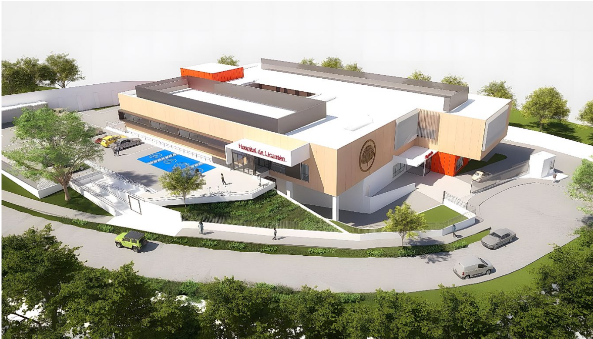
Render Hospital de Licantén