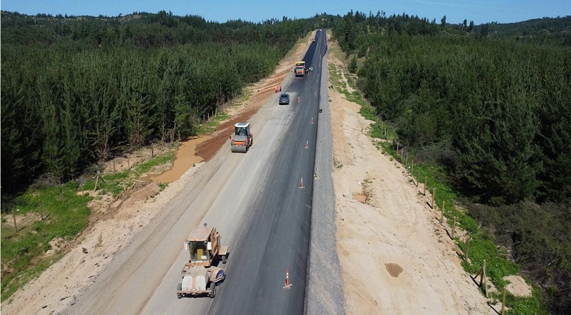
Mejoramiento Ruta J-80, Sector: Cruce J-60 (Hualañe) - Cruce Ruta Costera

Código Bip: 30107547-0 Monto Vigente: M$33.438.522 Obras en ejecución. Este proyecto estaría listo en 2027. Ejecución: 35,8%