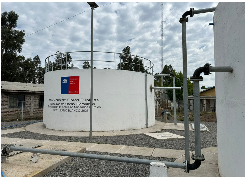
Apr Llano Blanco

El proyecto consta principalmente de las siguientes obras: - extensión y reemplazo de redes de hdpe pe100 pn10. De diámetros 75, 110 y 140 mm. - nuevo equipo presurizador, necesario para satisfacer la demanda de consumo estimada. - construcción de un estanque de regulación semienterrado de hormigón armado de 200 m3, que se complementara al existente de 75 m3.