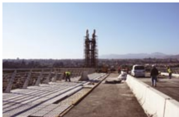
Puente Zorrilla en La Serena

Conscientes de que es necesaria preservar y potenciar las identidades y roles locales, a través de la recuperación del patrimonio histórico y arquitectónico sobre el cual se sustenta la identidad de una zona, el MINVU está abocado a la rehabilitación de los centros históricos y patrimoniales de nuestras ciudades.