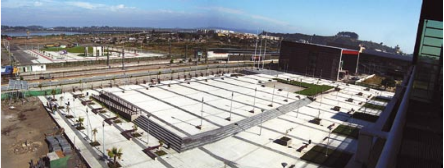
El Parque Central y la Plaza Bicentenario son piezas clave dentro del Gran Eje Bicentenario de Concepción.