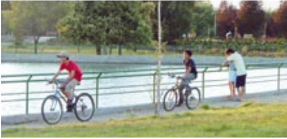
Parque Cataluña en Rancagua.