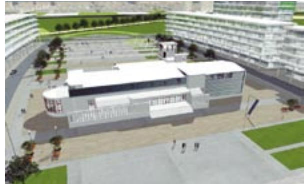
Se construirán 15 mil viviendas en barrios y departamentos con amplio equipamiento comunitario.

Durante el año 2006 se construyó la primera etapa de las obras públicas, que consistió en los primeros kilómetros de macroinfra-