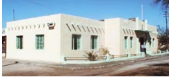
La Corporación Museo del Salitre desarrolla una importante labor de conservación de la Salitrea Humberstone en la Primera Región.

Los proyectos que se presentan a continuación, constituyen una muestra de las orientaciones planteadas en distintos ámbitos de la gestión de este Ministerio, es decir, conservación y puesta en valor del patrimonio histórico cultural, ecoturismo, conservación y ciencia, y desarrollo productivo.