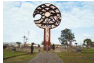
Acceso a Cañete Histórico