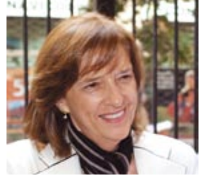
Patricia Poblete, Ministra de Vivienda y Urbanismo.

de Vivienda y Urbanismo ha estado construyendo una red de parques en diferentes ciudades del país.