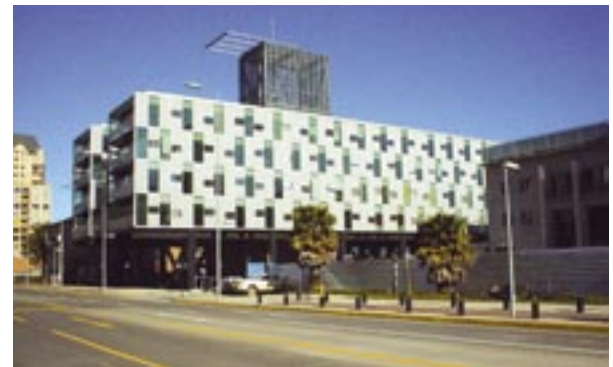
Edificio Servicios Públicos

Esta plaza constituye una pieza clave dentro del Gran Eje Bicentenario de la ciudad, el cual unirá la antigua