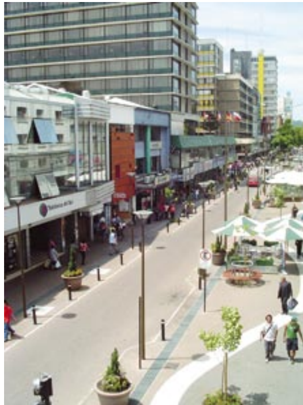
Boulevard Barros Arana en Concepción.

Uno de los ejes que sustentan el desarrollo de las Obras Bicentenario es abrir posibilidades de esparcimiento y recreación para la familia chilena. Es por ello que el Ministerio