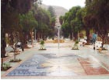
Bandejón central y veredas de la Avenida Alameda M. A. Matta en Copiapó.