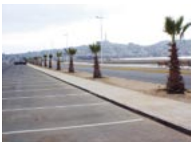
Tramo de Costanera desde Peñuelas hasta Coquimbo

A esta iniciativa se suma la ejecución del tramo de Costanera desde Peñuelas hasta Coquimbo, conectividad vial y paisajística que abre un polo de desarrollo turístico y a la vez genera accesos adecuados al puerto y centro de esa ciudad. Y en el sur del país, la ejecución de los ejes viales O'Higgins y Ejército en la ciudad de Puerto Montt, mejoran la interconexión entre los diferentes sectores de la capital de la X Región.