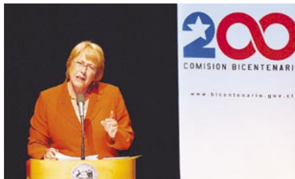
La Presidenta de la República, Michelle Bachelet, inauguró el Foro Bicentenario 2006.

Organizado por la Comisión Bicentenario y con el apoyo de la Embajada de Francia, la inauguración del Foro estuvo a cargo de la Presidenta de la República, Michelle Bachelet, quien en su alocución