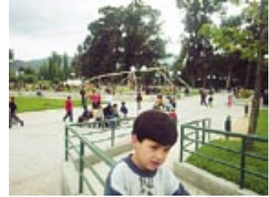
Parque Vergara de Angol.