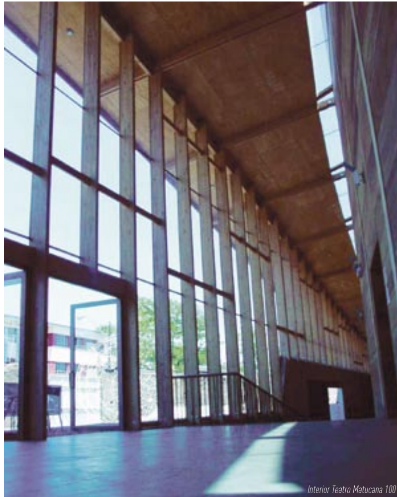
Interior Teatro Matucana 100

• Ofrecer espacios culturales tanto a los creadores como a la comunidad local.