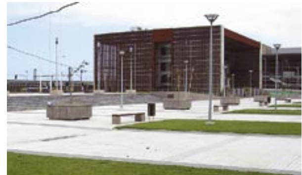
Plaza Bicentenario y el Parque Central del proyecto Ribera Norte de Concepción.

En este ámbito, proyectos como las Sendas Patrimoniales en el Cerro Santo Domingo , la recuperación de espacio urbano de la Plaza Echaurren y el entorno de la Iglesia Matriz en Valparaíso, revitalizan estos espacios pero respetando y valorizando el valor patrimonial que tiene este sector.