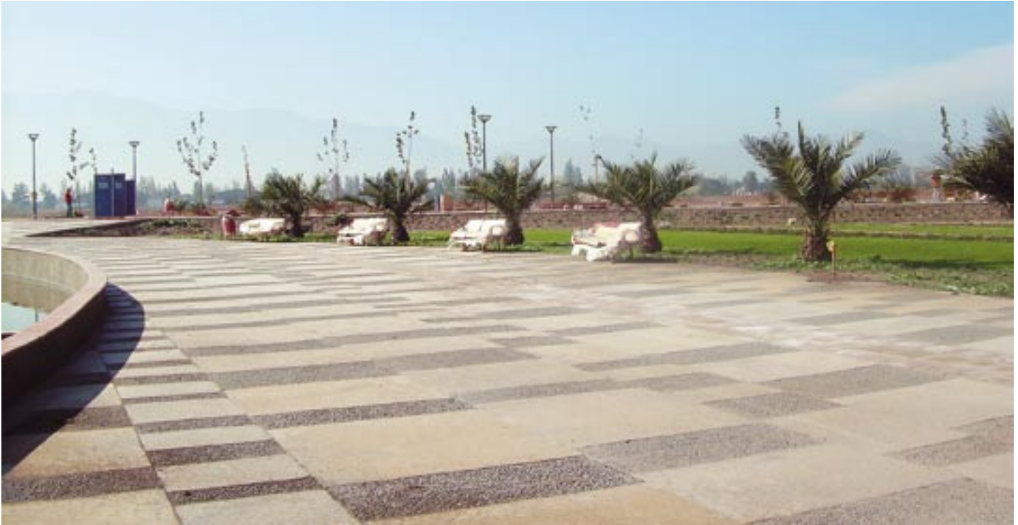
Plaza Juegos de Agua, Parque Central.