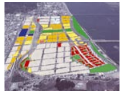
Fotomontaje Plan Maestro Eje Bicentenario y Ribera Norte.

Esta construcción, que se espera mejore la infraestructura pública y la calidad del servicio a la comunidad,