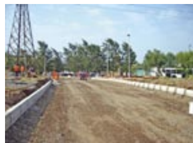
Etapas ejecución Avenida Bicentenario.

Anillo Cultural: Se propone preservar y resaltar el patrimonio existente junto con gestionar la incorporación de proyectos que