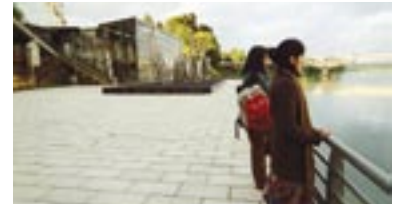
La costanera Peatonal Cultural de los Museos en Valdivia.

Algunas de estas iniciativas emblemáticas son el parque Cataluña en Rancagua, el estero Las Toscas en la ciudad de Chillán y el Parque Vergara de Angol.