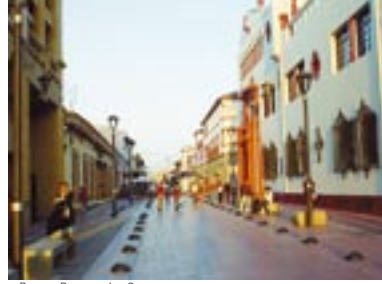
Paseo Prat en La Serena.