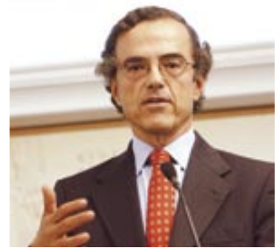
René Cortázar, Ministro de Transportes y Telecomunicaciones.

La Subsecretaría de Telecomunicaciones, a través del Fondo para el Desarrollo de las Telecomunicaciones, persigue disminuir la brecha digital y dotar de conectividad y otros servicios de telecomunicaciones a aquellos territorios que el mercado por sí solo no atiende en nuestro país. Por ello, durante 2006 trabaja en el proyecto denominado Fibra Óptica Austral, que pretende ampliar la red troncal de fibra óptica nacional existente desde Puerto Montt hasta Coyhaique, pasando por la isla grande de Chiloé. La región de Aysén sólo se conecta hasta ahora a través de enlaces vía microon-