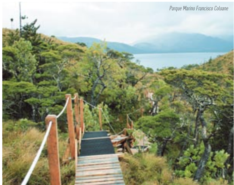
Parque Marino Francisco Coloane

Se permitió así, la integración de espacios terrestres, marítimos e insulares en un área protegida.