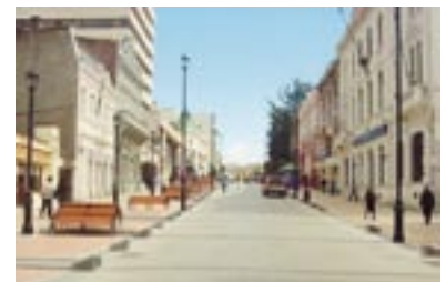
Remodelación de la plaza Muñoz Gamero y el Paseo Roca de Punta Arenas.