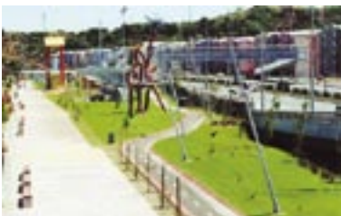
Parque Costanera de Concepción.

Las personas requieren trasladarse en forma segura, cómoda y rápida. Por ello se hace necesario desarrollar vialidad que les permita acceder adecuadamente a zonas laborales, residenciales y servicios públicos. En esta línea de acción, el MINVU ha desarrollado iniciativas como el eje vial y Puente Zorrilla en La Serena, que conecta al centro histórico, generando vías que facilitan y mejoran el traslado de la población.