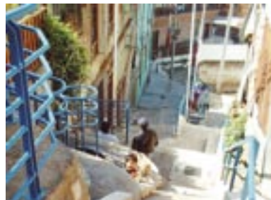
Cerro Santo Domingo en Valparaíso