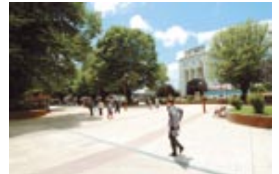
Paseo Ramírez y Plazuela Yungay en Osorno.