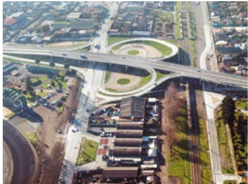
Paso sobre nivel Las Golondrinas, VIII región.

Las obras realizadas en estas caletas pesqueras constituyen un avance en la tarea de llegar al Bicentenario con ciudades-puerto con mejor calidad de vida y más integradas con su entorno. Los pescadores ven mejoradas sus condiciones de trabajo y la comunidad tiene la posibilidad de estrechar su contacto con el bordemar.