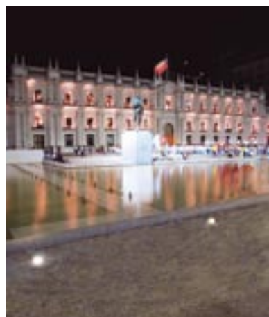
Plaza de la Ciudadanía, Santiago.

“ NUESTRO COMPROMISO con el Bicentenario está orientado a concretar obras que contribuyan al crecimiento del país, perfeccionar nuestra conectividad y aportar al aumento de la calidad de vida de sus habitantes. Ello se traduce en una mejor integración de aquellos territorios de difícil acceso, así como también en una mayor inserción del país con el mundo global. Hoy el Ministerio de Obras Públicas trabaja en conjunto con los ministerios de Vivienda y Transportes en el desarrollo de planes de infraestructura