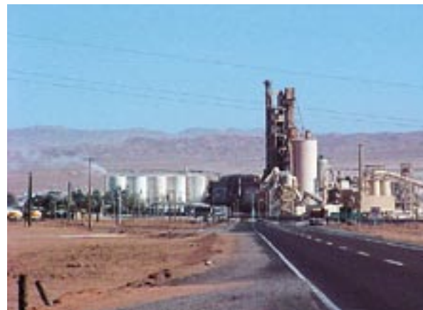
Conglomerado industrial La Negra, Antofagasta.

El Ministerio de Bienes Nacionales, se ha planteado contribuir al logro de un desarrollo territorial equilibrado, donde se exprese una voluntad política de descentralización económica y demográfica.