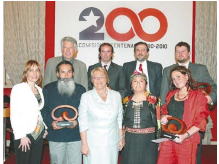
Ganadores del Sello Bicentenario 2006 recibieron sus estatuillas de manos de la Presidenta Michelle Bachelet.