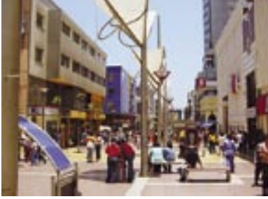
Paseo Prat en Antofagasta.