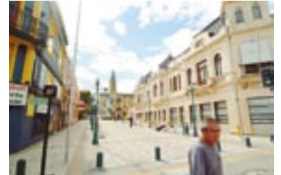
El Paseo Libertad en Valdivia.