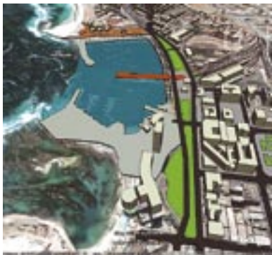
Fotomontaje Costanera Central.

La consolidación del borde costero como principal espacio público de la ciudad, busca rescatarlo como referente de identidad por su valor paisajístico y recreativo.