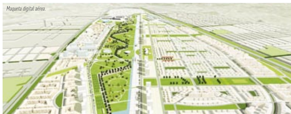
Maqueta digital aérea.

estructura vial y servicios, y en la consolidación de la primera fase del Parque Central. Así mismo, concluyó con éxito la primera licitación pública de 25 hectáreas de terrenos para viviendas y comercio.