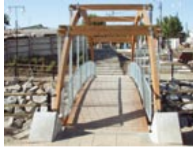
Estero Las Toscas en la ciudad de Chillán.