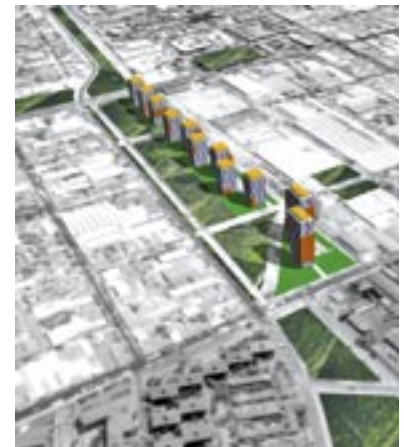
Fotomontaje Renovación Urbana.

Anillo Renovación Urbana: Esta área posee una importante oferta de suelo para desarrollo y/o renovación urbana, con óptimas condiciones y dotaciones de infraestructura de servicios. Éstos suman, al menos, 250 hectáreas de sitios eriazos, grandes paños y terrenos con edificación deteriorada, que en gran parte son propiedades públicas. Se apunta a la intensificación del uso del suelo con actividades residenciales, de equipamiento, servicios y productivas.