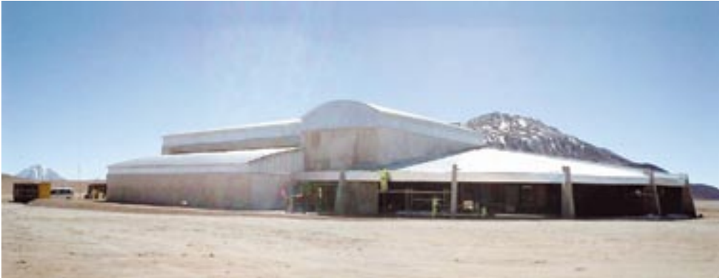
Edificio de Ensamblaje de Antenas.