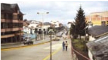
Eje vial Ejército en Puerto Montt