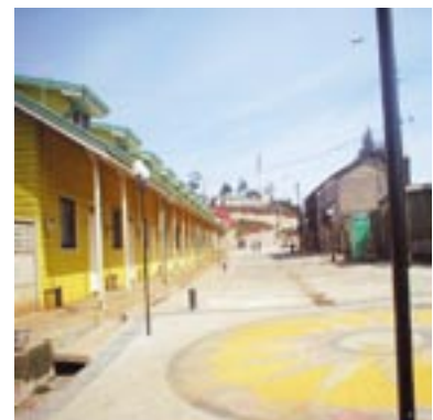
Barrio Chino de Lota

Más al sur, el proceso de revitalización de los barrios patrimoniales continúa, con proyectos como la recuperación de espacios públicos en el entorno de El Pabellón 83 y el Barrio Chino de Lota, y el acceso a Cañete Histórico .