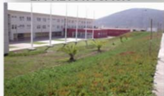
EP. LA SERENA