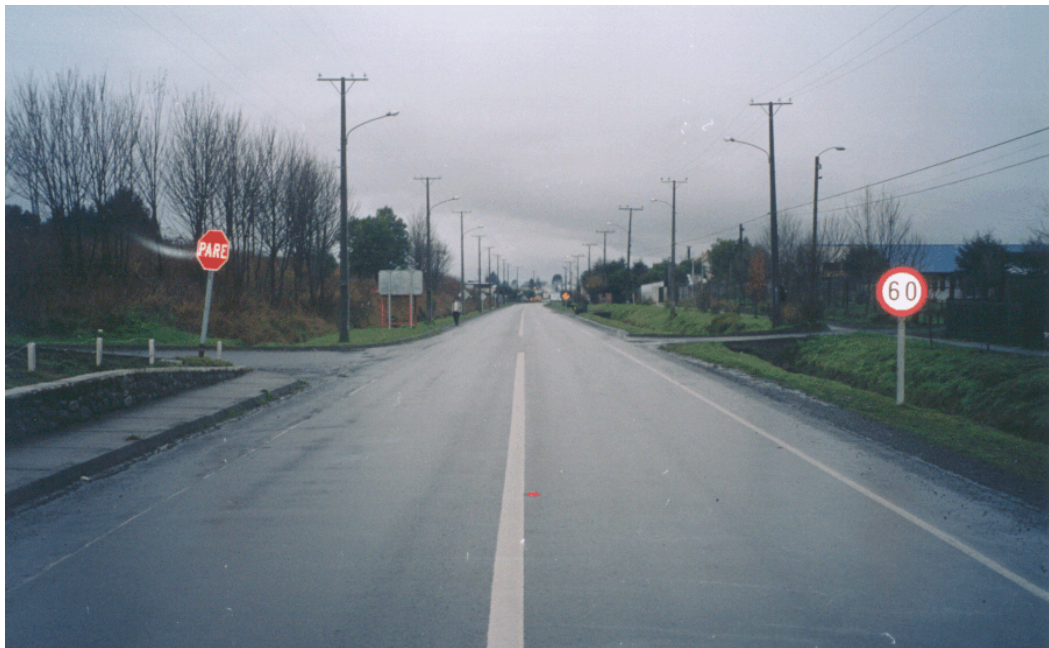
Foto de intersección de ruta R-755 y R-89 en km58,870 de la Ruta Interlagos.

A continuación se pueden apreciar las características del trazado en la zona urbana de Curacautín