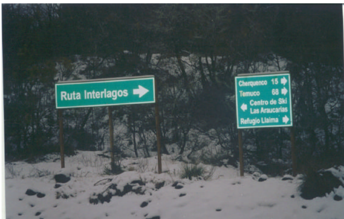
Bifurcación a Centro de Esqui Las Araucarias. Km. 96,800