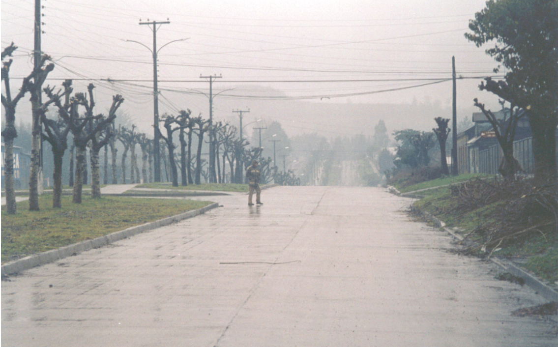
Avda. Arturo Pérez en Curacautín.