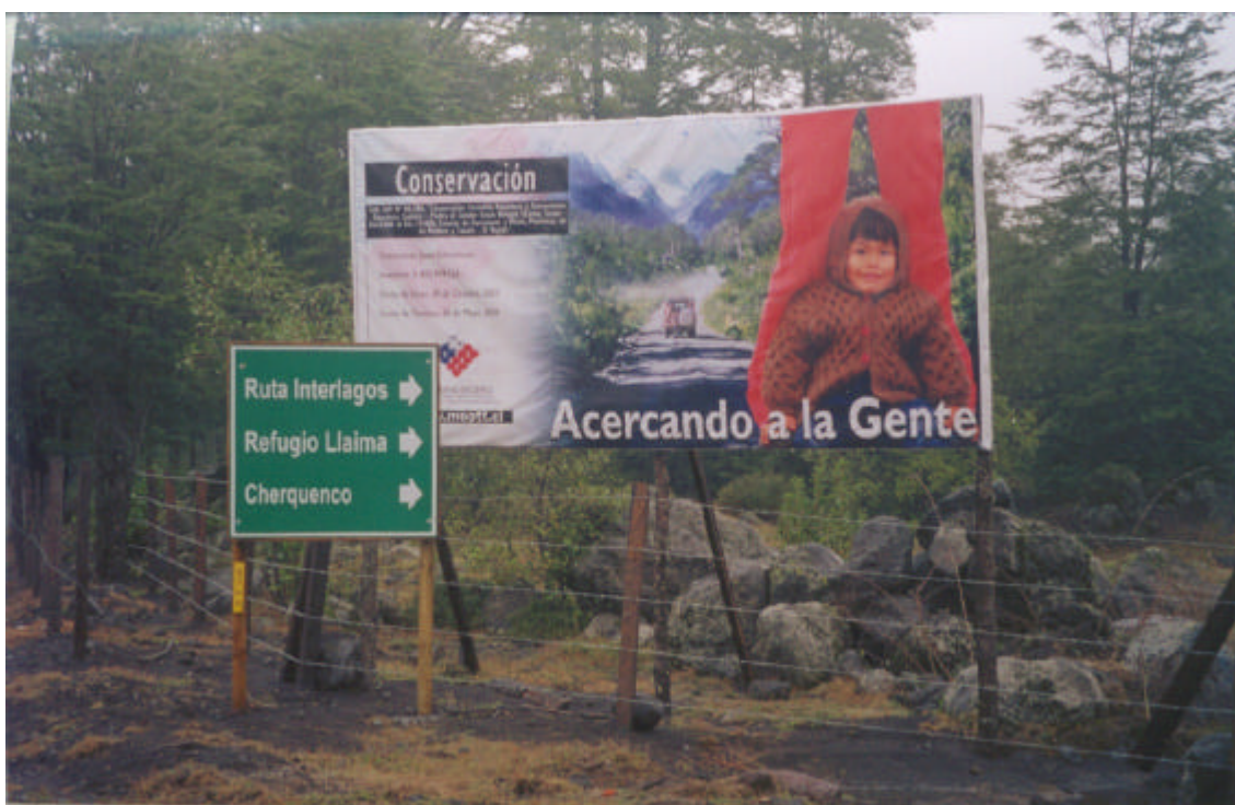
Km. 79,140 Fin del tramo 2.1