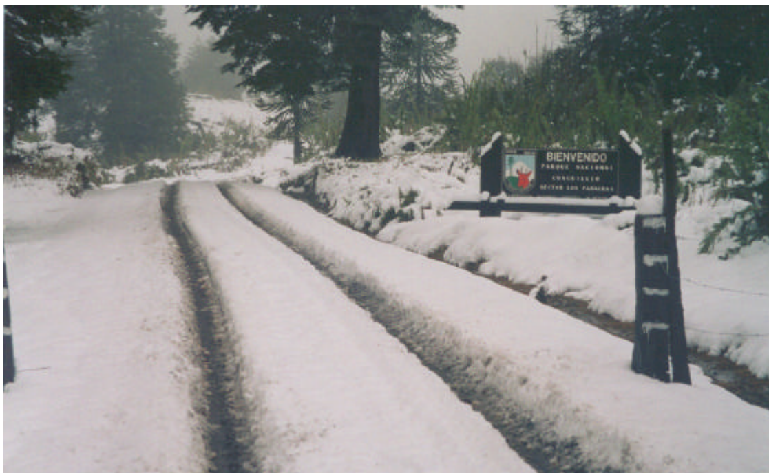
Km. 91,500 Entrada Parque Nacional Conguillio, Sector Los Paraguas.