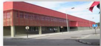
EP PUERTO MONTT