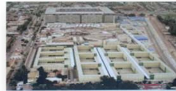
EP SANTIAGO 1