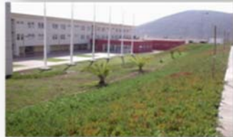
EP. LA SERENA