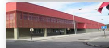
EP PUERTO MONTT