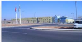
EP. ALTO HOSPICIO