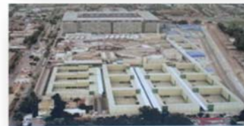
EP SANTIAGO 1